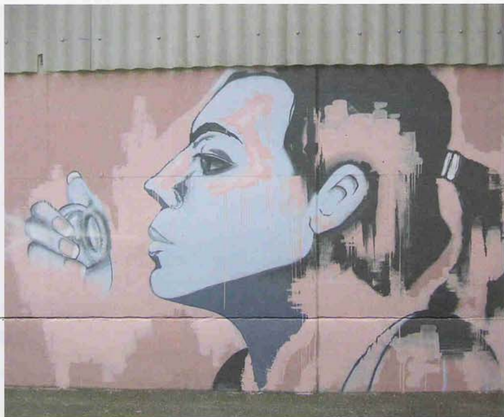
Oeuvre murale de David A. Lucco